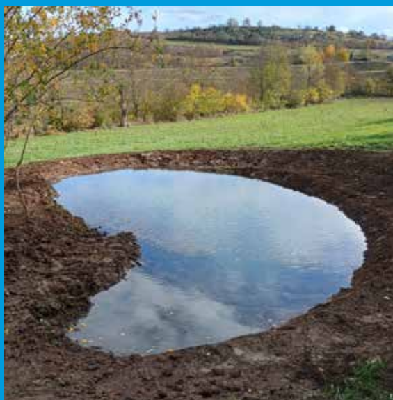
Mare créée en 2025